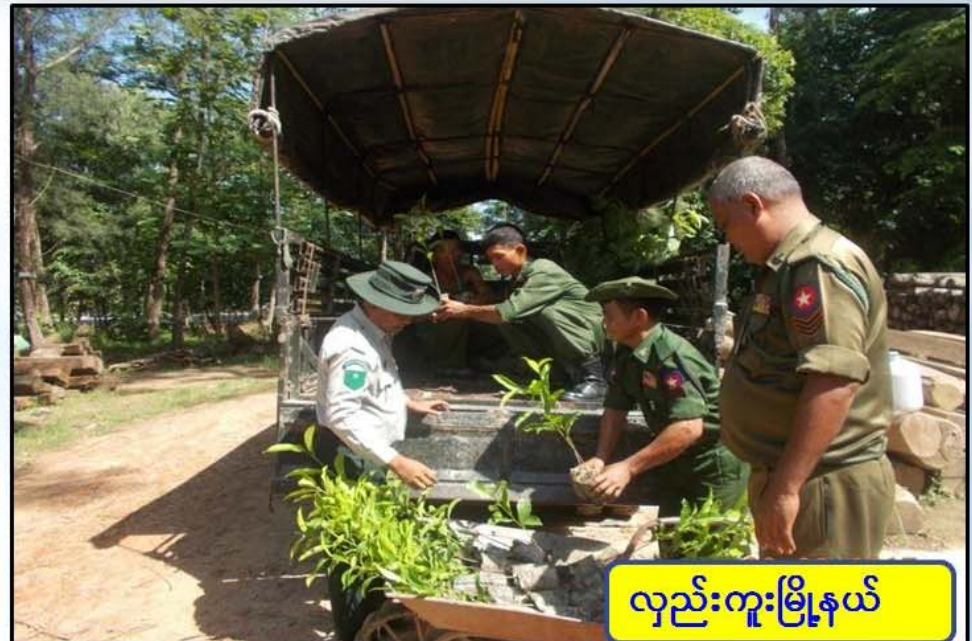
လှည်းကူးမြို့နယ်