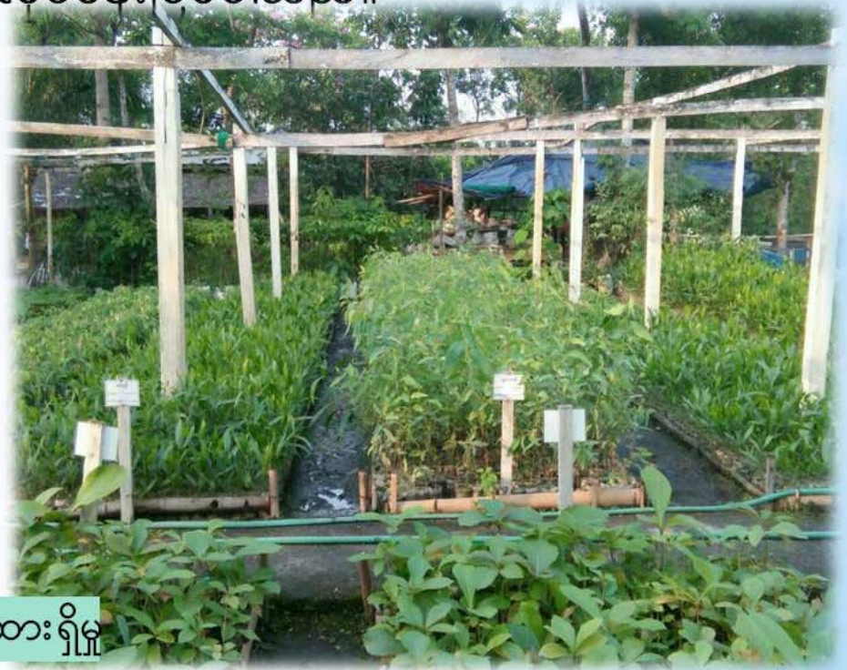
ပျိုးထောင်ထားရှိမှု