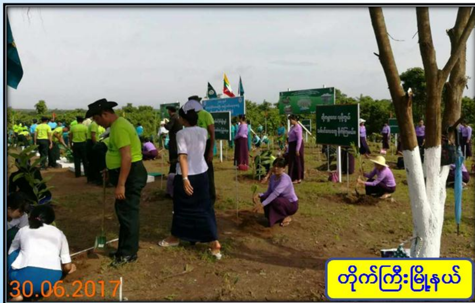
တိုက်ကြီးမြို့နယ်