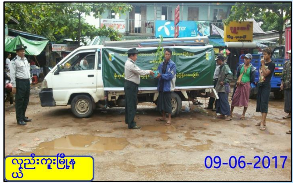
လှည်းကူးမြို့နယ်