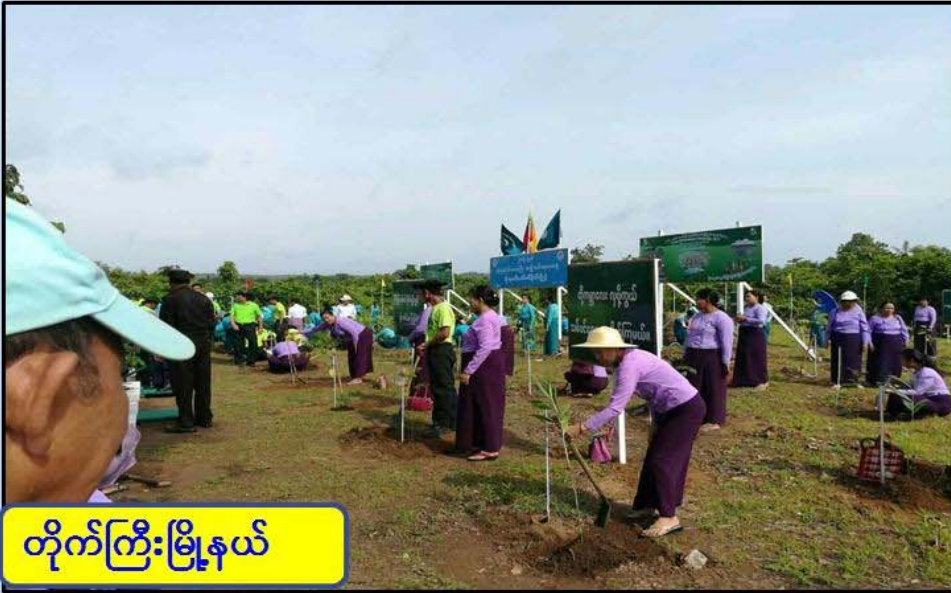
တိုက်ကြီးမြို့နယ်