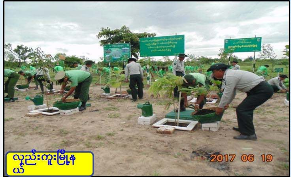
လှည်းကူးမြို့နယ်