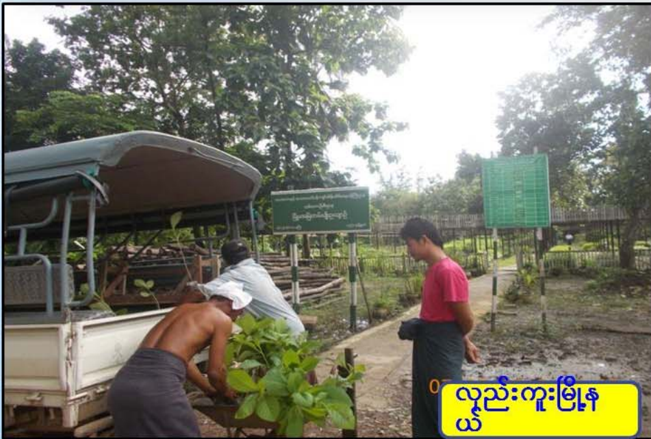
လှည်းကူးမြို့နယ်