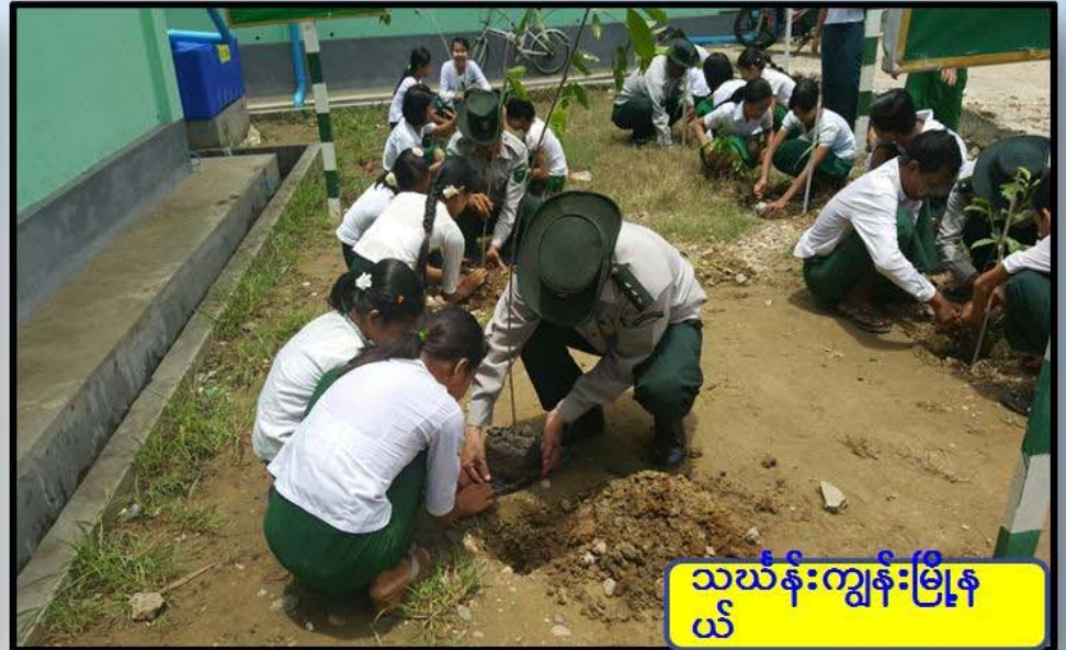
သစ်ပင်ကွန်းမြို့နယ်