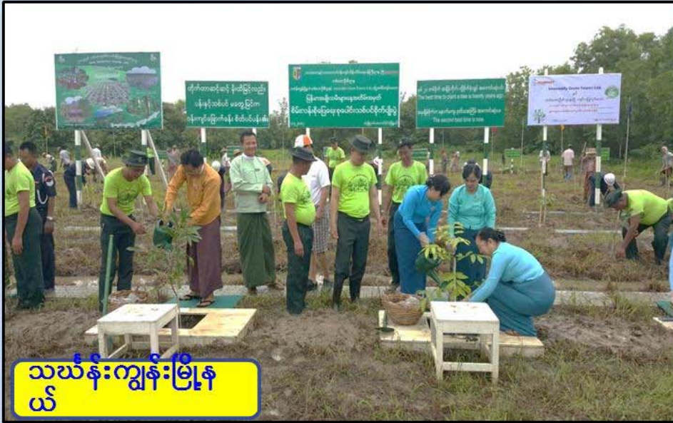
သစ်နန်းကျွန်းမြို့နယ်